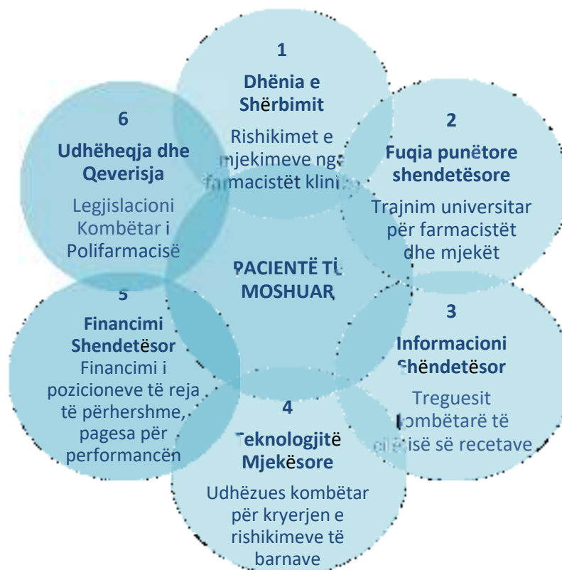
Skema 1. STUDIMI I RASTEVE TË UPPSALËS (SUEDI) DUKE APLIKUAR BLOQET E NDËRTIMIT TË OBSH

Kompleksiteti i sistemeve mund të ndikojë në rezistencën ndaj ndryshimit. Interesat konkurruese të profesionistëve të ndryshëm që luajnë rol në menaxhimin e polifarmacisë, veçanërisht ato të