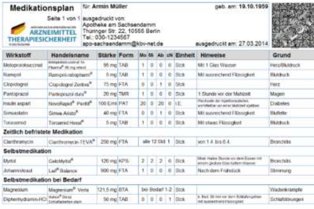
Figura 1. Tabela standarte e ilaçeve të pacientit në Gjermani

Më poshtë është një shembull e tabelës standarte të ilaçeve të pacientit në Gjermani: