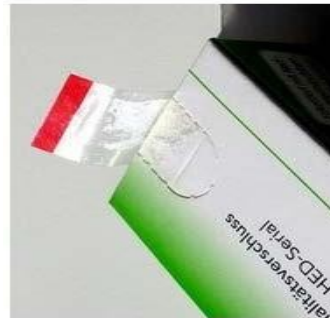
Figura 2. Element i cili parandalon manipulimin