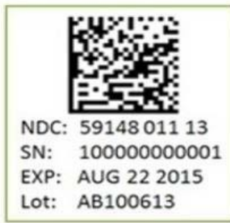
Figura 1. Identifikuesi unik