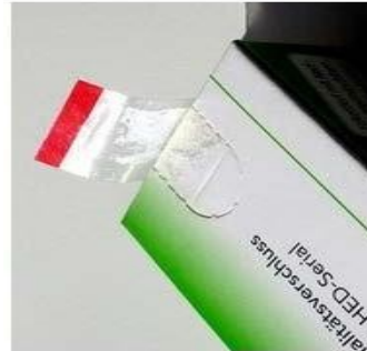
Figura 2. Element i cili parandalon manipulimin